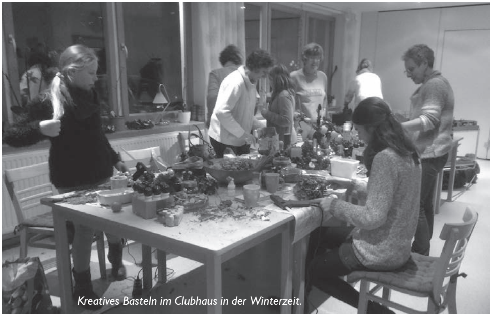
Kreatives Basteln im Clubhaus in der Winterzeit.