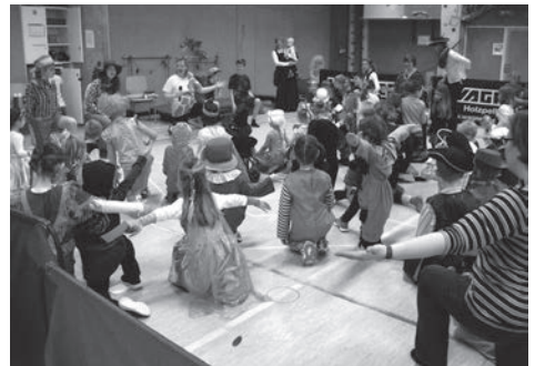
... und hatten viel Spaß dabei

es mit dem Tanzen weiter. Manche Tänze werden jedes Jahr immer wieder getanzt, zum Beispiel „Flitze Flattermann“ oder „Kika Tanzalarm“. Deshalb können die Kinder die Bewegungen auch schon so gut wie auswendig, trotzdem gibt es auch immer ein paar Tänze, die etwas mit dem Motto zu tun haben. Dieses Jahr zum Beispiel „Wer will mit auf Safari gehen?“ oder „Das Krokodil am Nil“. Eines der Highlights war natürlich wieder das Bonbon-Werfen am Schluss zu dem Lied „Bye,Bye ihr Kinder“.