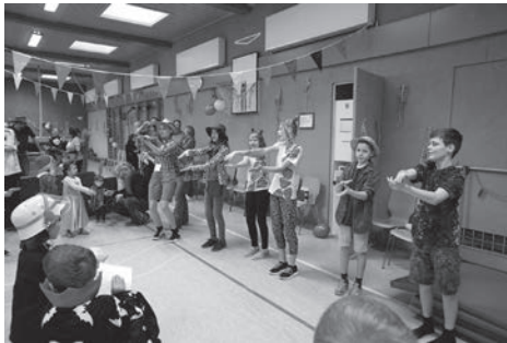
Vortanzen für die Kinder