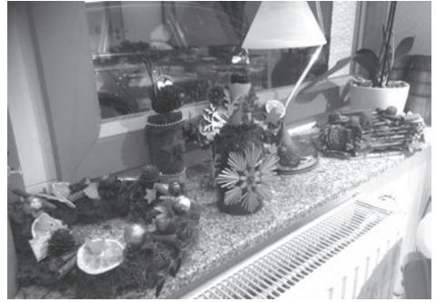
Wunderschön: Aus kreativen Ideen entstanden hübsche dekorative Bastelarbeiten.

Wir freuen uns schon auf den nächsten Bastel-Termin, denn der steht bereits fest: