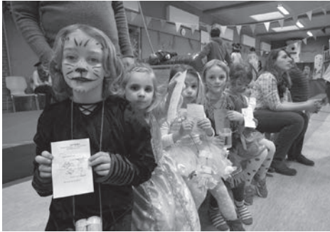
Stolz zeigen die kleinen Faschingskinder in ihren hübschen Kostümen ihre abgestempelten Stationskarten.