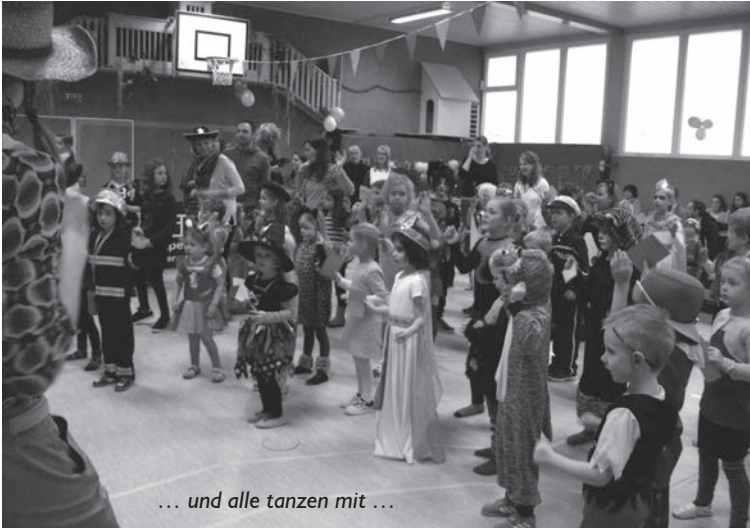
... und alle tanzen mit ...