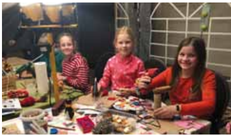
Mit viel Phantasie entstanden wunderschöne, kreative Weihnachtsdekorationen.

Bereits am Nachmittag des gleichen Tages durfte natürlich auch das beliebte Weih-