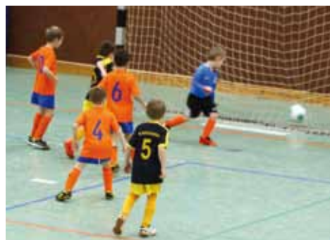
Man kann es sehen: Spaß und Freude stehen beim Spiel der U7 an vorderster Stelle.

von der Spielfreude ihrer Sprösslinge sofort gepackt. Insgesamt ziehen wir für die Kleinsten eine sehr positive Bilanz aus den bisherigen Punktspielen (Punktspiele sind in der U7 ohne Wertung – der Spaß steht im Vordergrund).