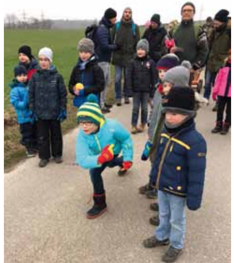
Viel Spaß bereitete gerade den Jüngsten das Boßeln während der Braunkohlwanderung.

Die neue Saison soll am 25. April ab 14.00 Uhr eröffnet werden, vorausgesetzt das Wetter spielt mit. Nach bewährtem