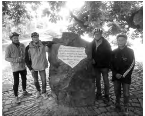
Die vier Radler vor dem bekannten Weserstein.

Am zweiten Tag radelten wir über Kloster Bursfelde und Gieselwerder in das Hugenotten-Städtchen Karlshafen und übernachteten im altehrwürdigen Hotel „Zum Schwan“ direkt am Hafen. Entlang den hannoverschen Klippen fuhren wir am nächsten Morgen nach Würgassen und setzten mit der Personenfähre nach Herstelle auf die linke Weserseite über. Weiter ging es nach Beverungen