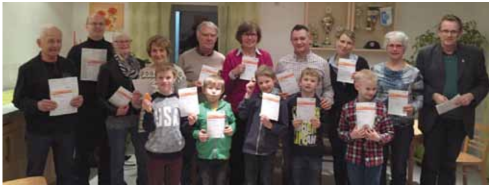
Sportabzeichenverleihung März 2016