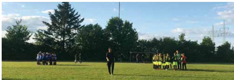
Fußball-Freude auf dem grünen Rasen