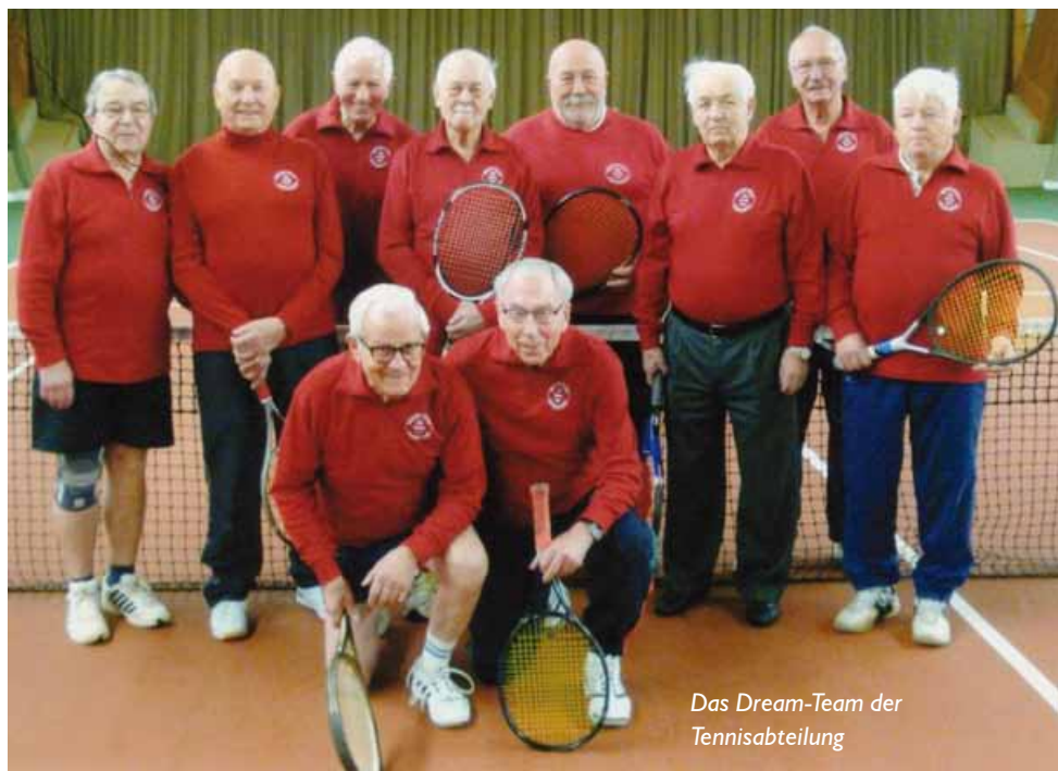
Das Dream-Team der Tennisabteilung