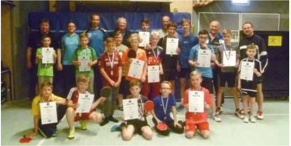
Viel Spaß hatten die Spieler beim Kuddel-Muddel-Turnier