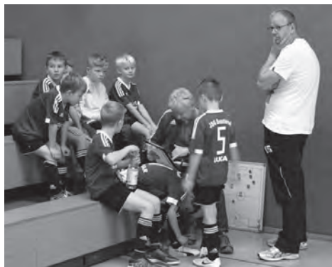
Taktikbesprechung beim Punktspieltag