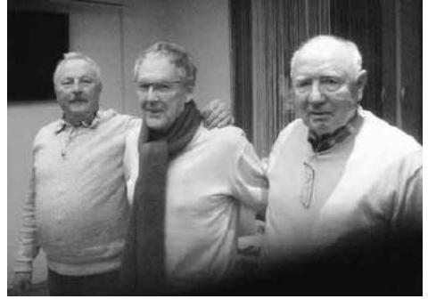
Gluckliche Sieger beim Preisskat