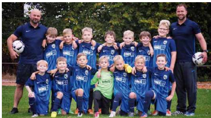
Herbstmeister 2018 und Staffelmeister 2019