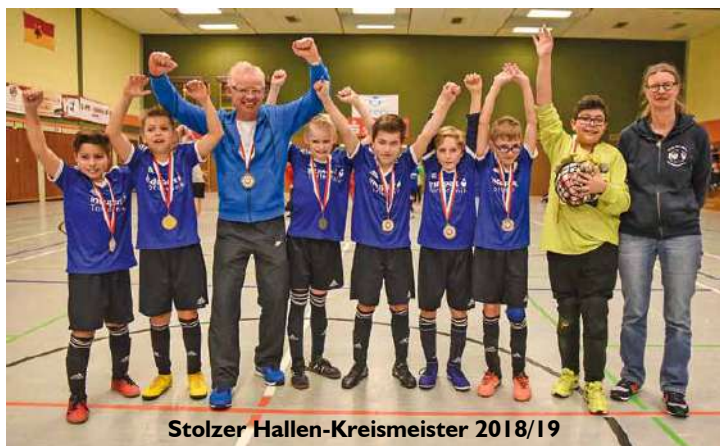
Stolzer Hallen-Kreismeister 2018/19

meister geworden und hat sich für die Hallen-Kreismeisterschaft am 16. Februar in Schellerten qualifiziert.