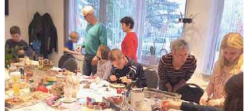
Ob sitzend oder stehend, ob klein oder groß: Alle waren mit großem Eifer dabei.