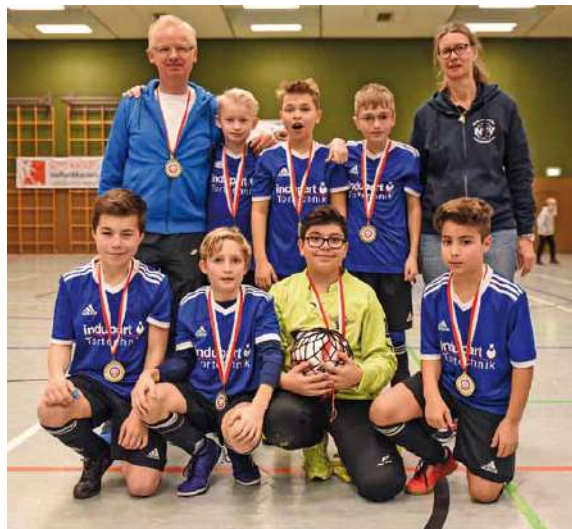
Die JSG Beustertal in Hannover-Anderten

Am 27. Dezember folgte der WinterCup der Sportfreunde Anderten 1922 e.V. in Hannover. Die Beustertaler mussten gegen sehr durchsetzungsstarke Mannschaften aus Hannover antreten, ließen sich aber nicht unterkriegen und kämpften bis zum Schluss. Die Jungs wurden völlig überraschend mit einem starken zweiten Platz belohnt.