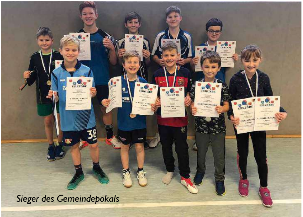
Sieger des Gemeindepokals