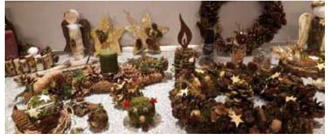
Individuell und vielfältig: Wunderschöne Advents- und Winterdekoration waren das Ergebnis.