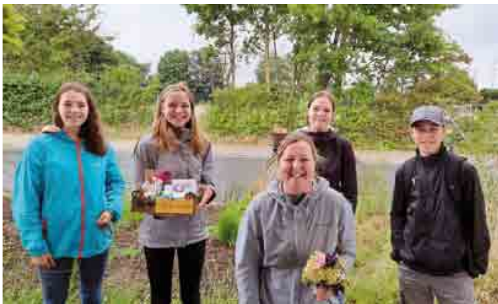
Das Kinderturn-Team hatte viel Spaß beim Verteilen der Abschiedsgeschenke an die TURNados.

Trinkflaschen sind so typisch für das Kinderturnen. Sie stehen nicht nur immer in Reih und Glied auf der gleichen Bank, sondern es gibt immer bestimmte Trinkpausen, die ein richtiges Ritual für die Kinder geworden wa-