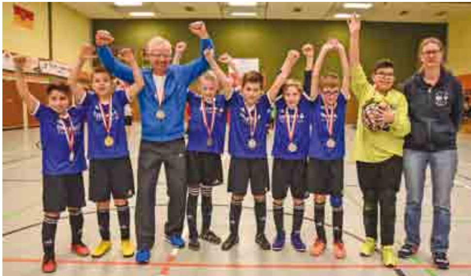
Kreismeister 2019, die JSG Beustertal U13