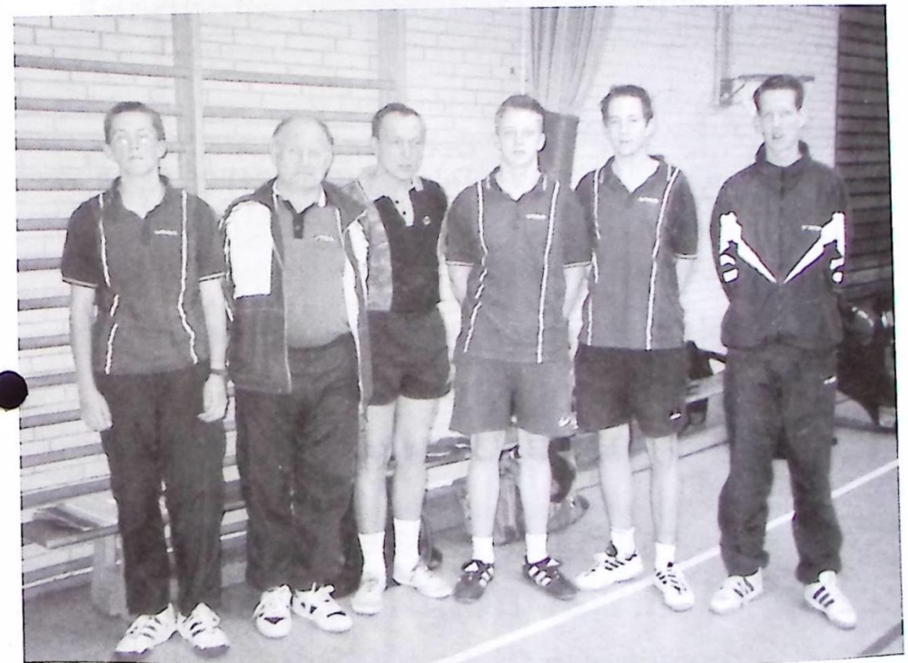
Die 3. Herrenmannschaft