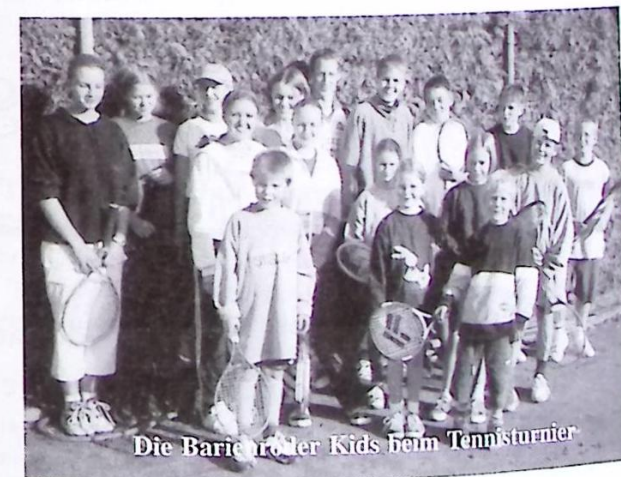
Die Barienroder Kids beim Tennisturnier

Damit das Gelernte weiter verfolgt wird und nicht einrostet, findet auch während der Winterzeit jeden Freitag im Sportcenter von Himmelsthür ein Hallentraining statt.