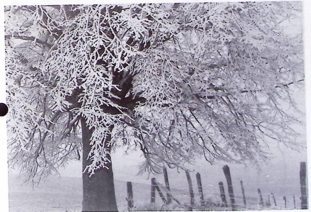
Winter in Barienrode