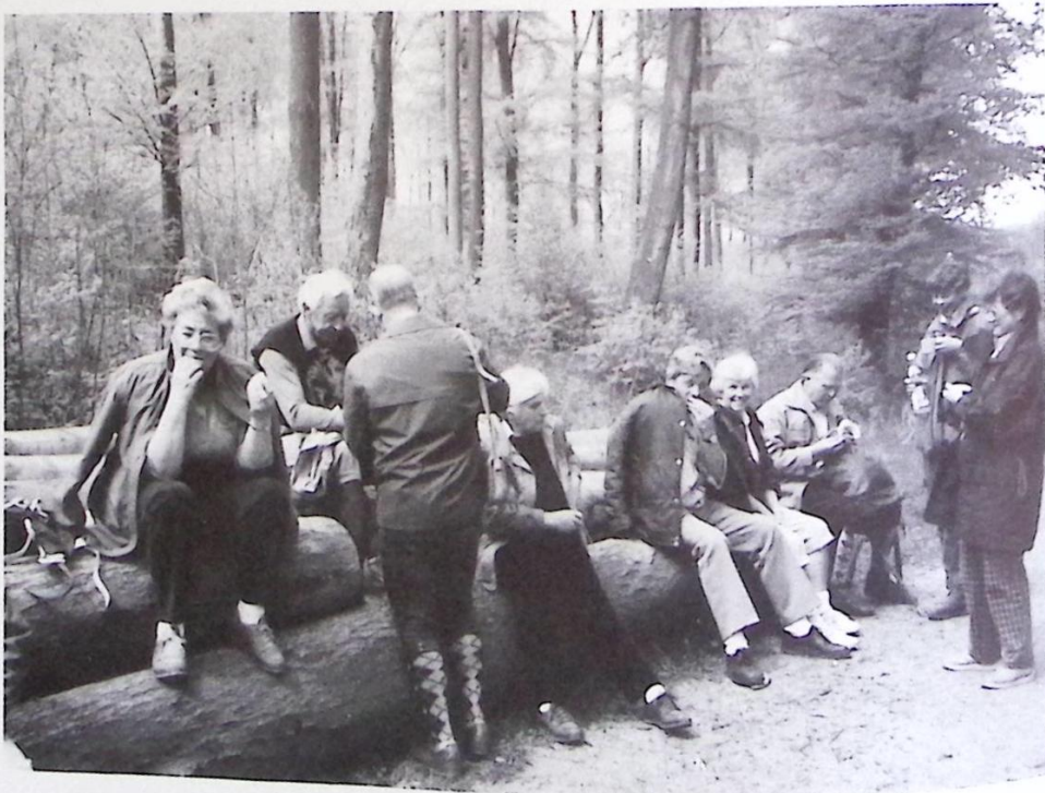
Frühjahrswanderung durch den Hildesheimer Wald

Herzliche Einladung zu unserer Herbstwanderung am Sonntag, dem 8. Oktober. Bitte beachten Sie zu gegebener Zeit die Anschläge und die Vereinsnachrichten in der HAZ, ob Fahrgemeinschaften gebildet werden müssen oder nicht!