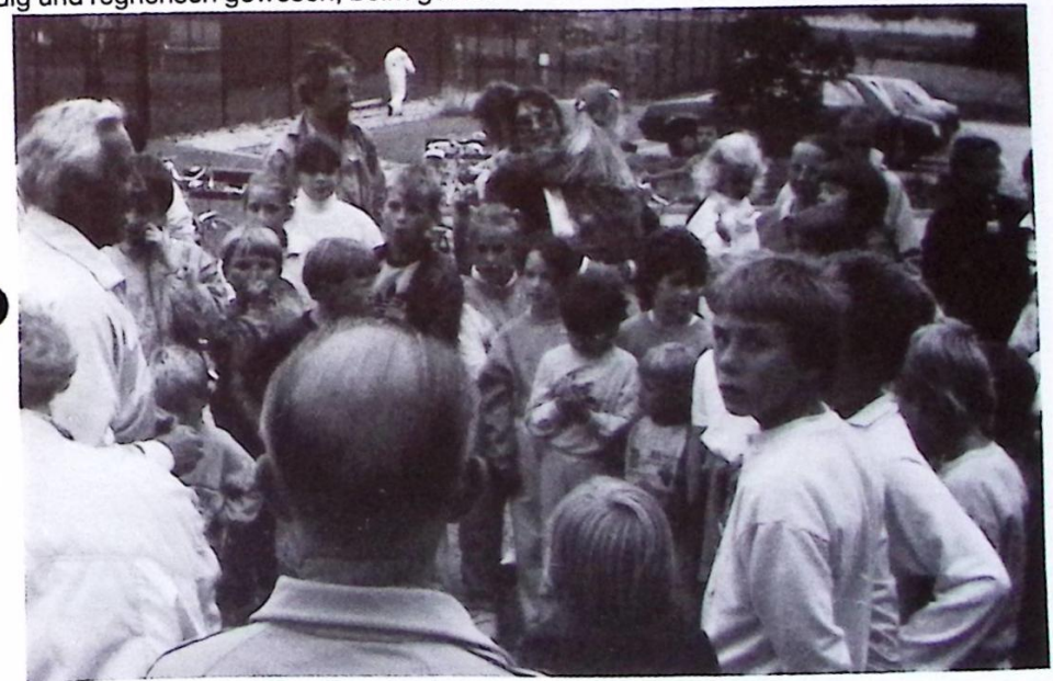
Gespannte Atmosphäre vor der Siegerehrung