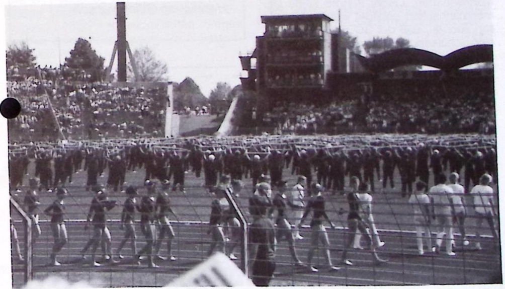
9. Niedersächsisches Landesturnfest in Hannover