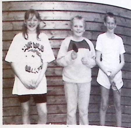
Sieger des Kuddel-Muddel-Mixed-Turniers

In die neue Saison startet der SC mit drei Herrenmannschaften und fünf Jugendmannschaften. Leider konnte keine Damenmannschaft gebildet werden. Erfreulich aber ist, daß der SC zum ersten Mal eine Schülerinnen C gemeldet hat.