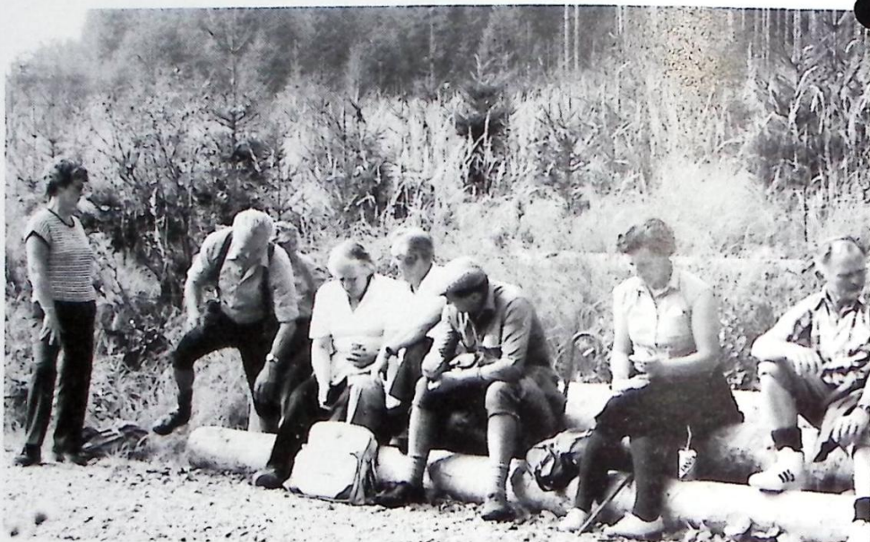
Sommerzeit – Wanderzeit