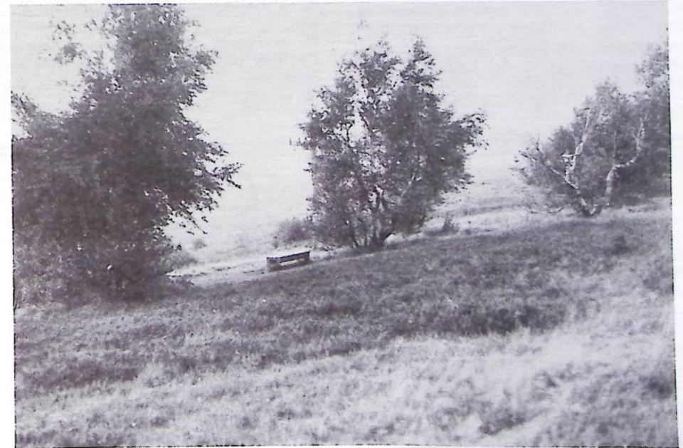
Der Mühlenberg — ein Vogelparadies

Kursierende Gerüchte bzw. Andeutungen, der Verein befinde sich in einer ‚Krise‘, veranlaßten Hans Görtz noch einmal zu einer grundsätzlichen Betrachtungsweise. Er meinte: weil alle Sporttreiben wollen, Gleichgesinnte sind, und