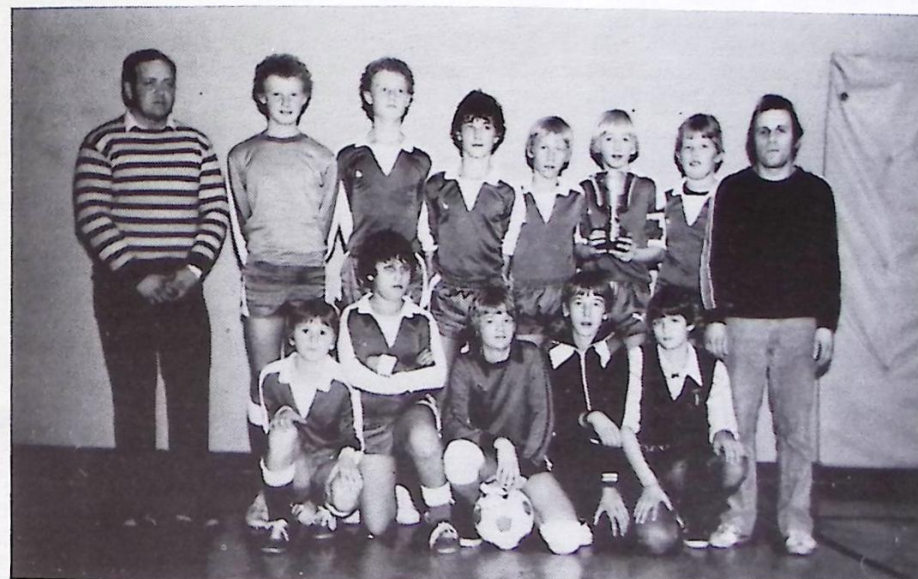
Unsere C-Jugend, der Hallenkreismeister 1981/82.