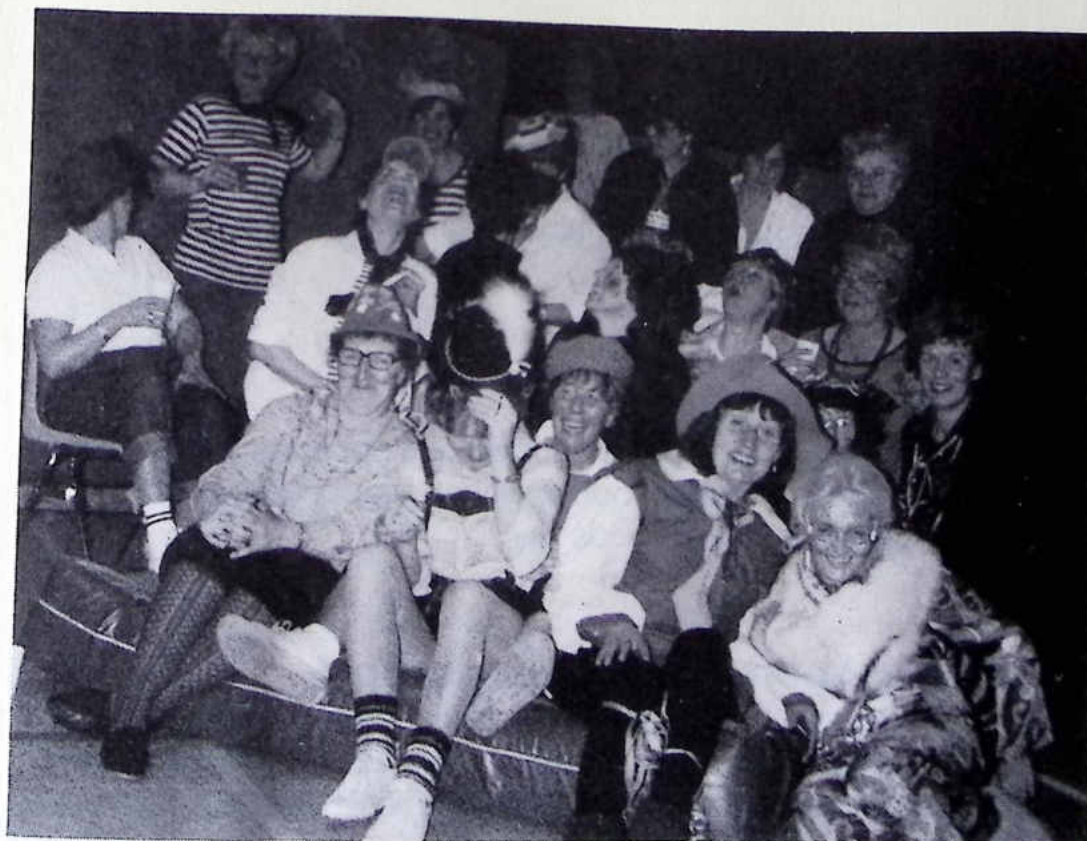
Munter und fidel ging's wieder zu beim Weiberfasching 1987 in der Sporthalle.