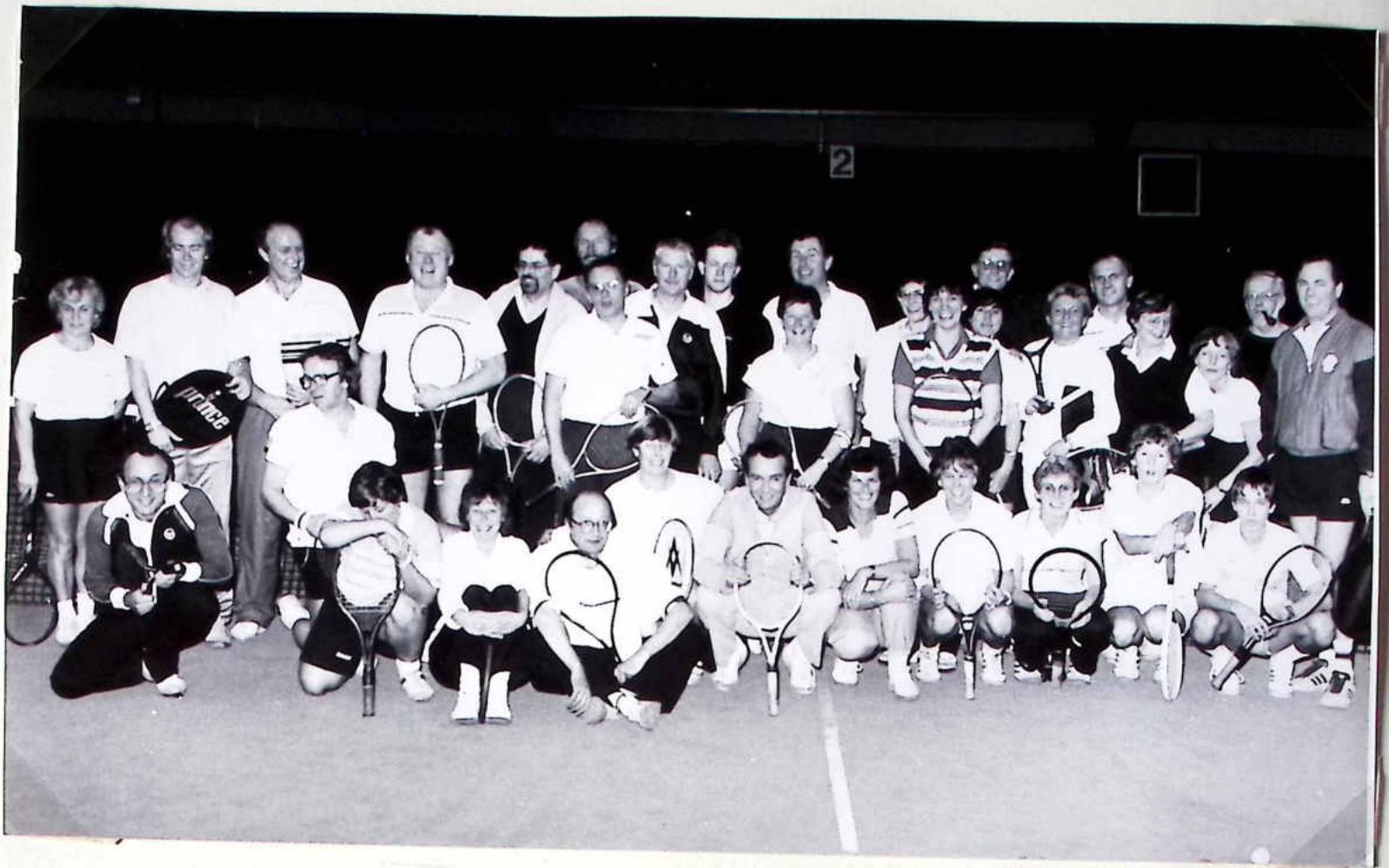
Die fröhliche Runde der Teilnehmer am Silvester-Kuddel-Muddel-Turnier | 1986