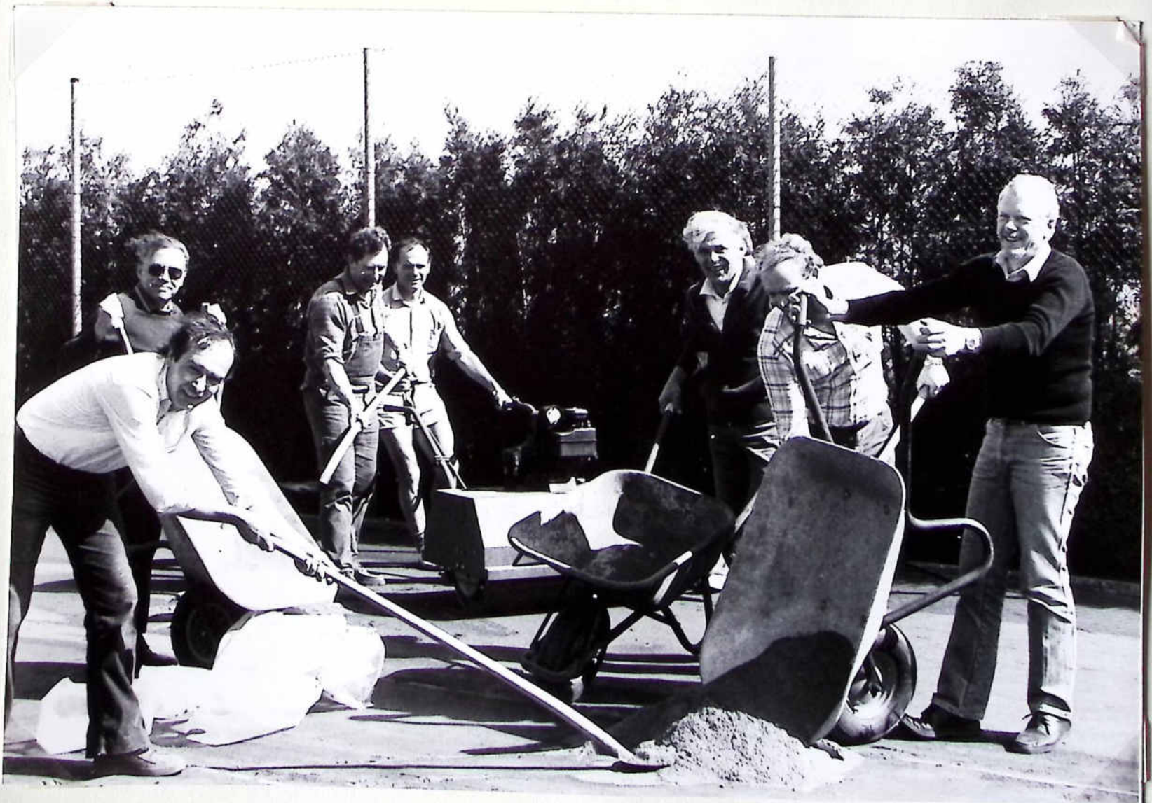
Wie immer nur ein kleiner, aber aktiver Kreis von freiwilligen Helfern bei der Frühjahrsüberholung unserer Tennisplätze. Die Arbeit ist geschafft, die Sommersaison kann beginnen.