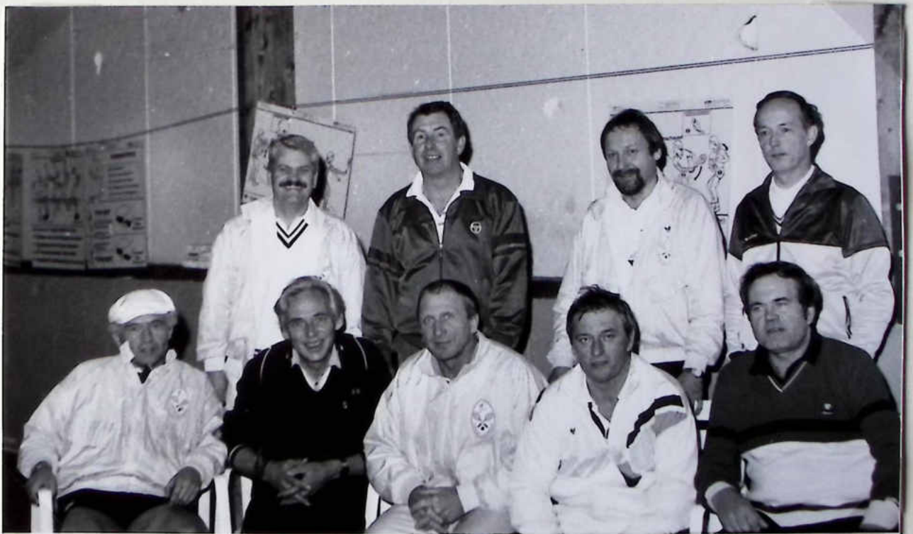
Unsere Tennissenoren - in bunter Reihenfolge mit der Mannschaft des TC Hämelerwald - dokumentieren die freundschaftliche Atmosphäre trotz des sportlichen Wettkampfes.