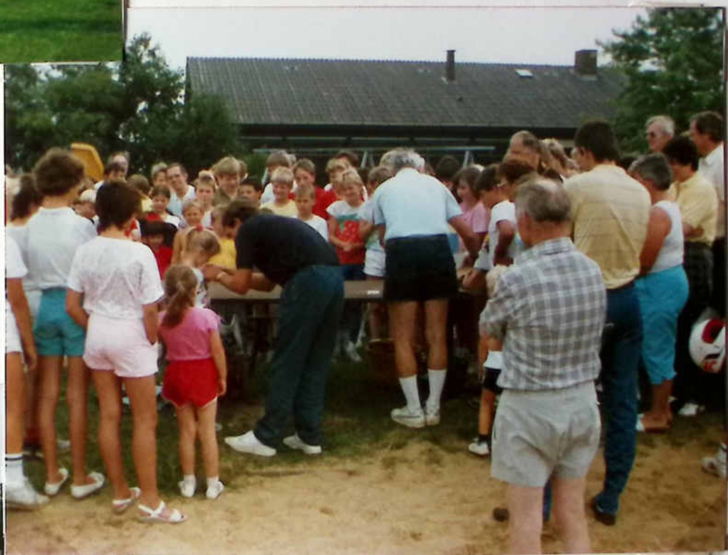
Siegererhebung 110 Mehrkampf- Madeln verliehen!