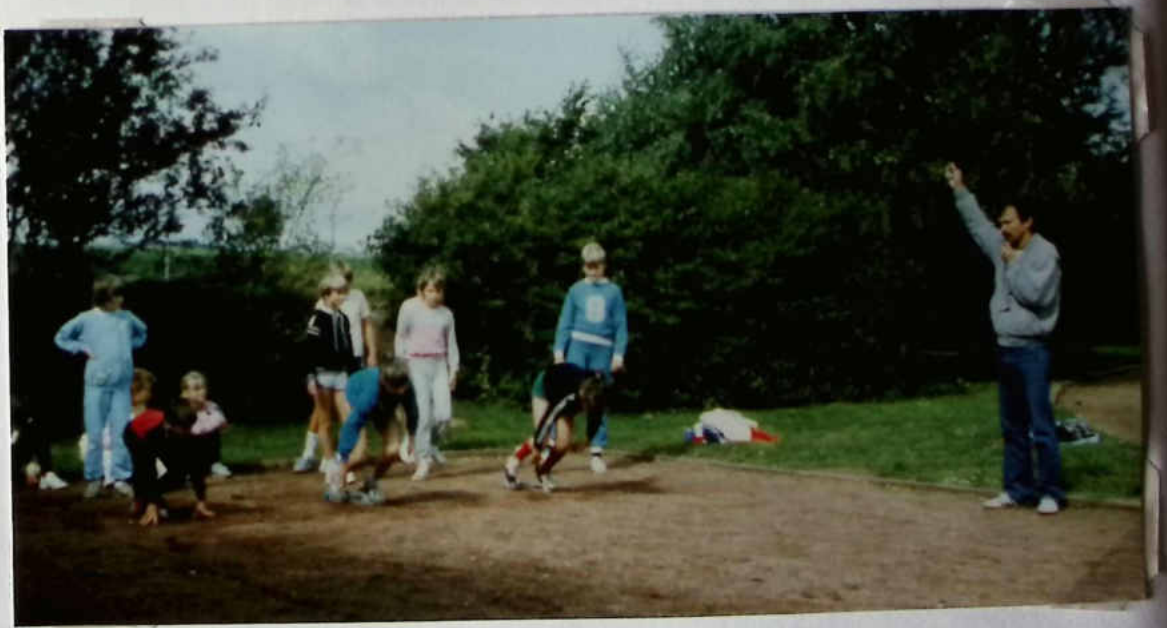
Start zum Kurzlauf --

Ein buntes Kuchenbuffet wird aufgebaut, die Musikvereinigung Barienrode sorgt ab 13 Uhr für weitere Unterhaltung. Ein gemeinsamer Abschluß ist mit einem Lagerfeuer geplant.