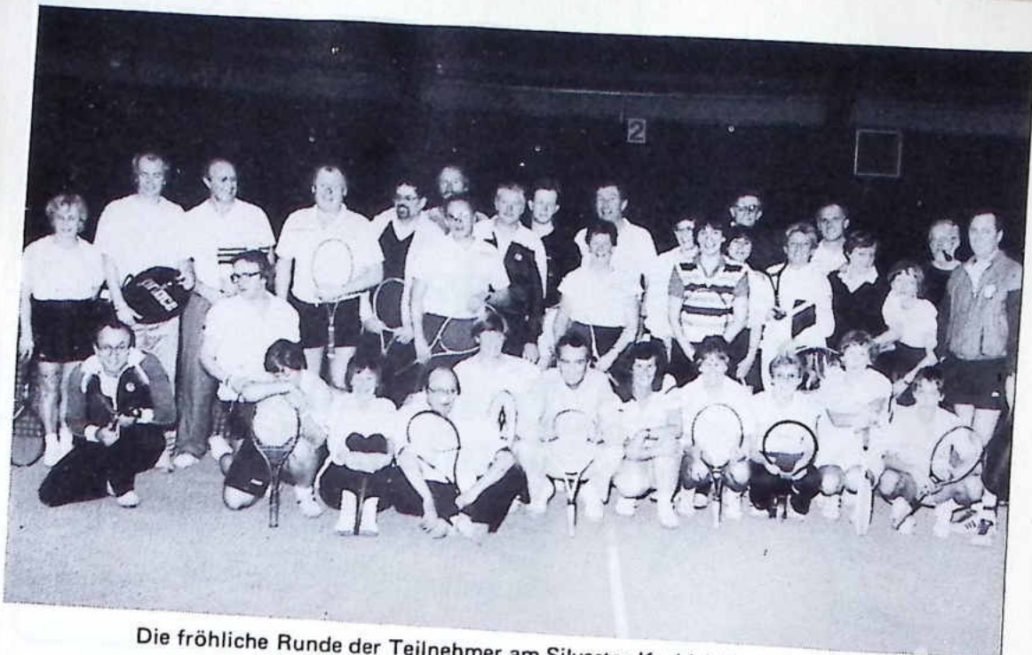
Die fröhliche Runde der Teilnehmer am Silvester-Kuddel-Muddel-Turnier