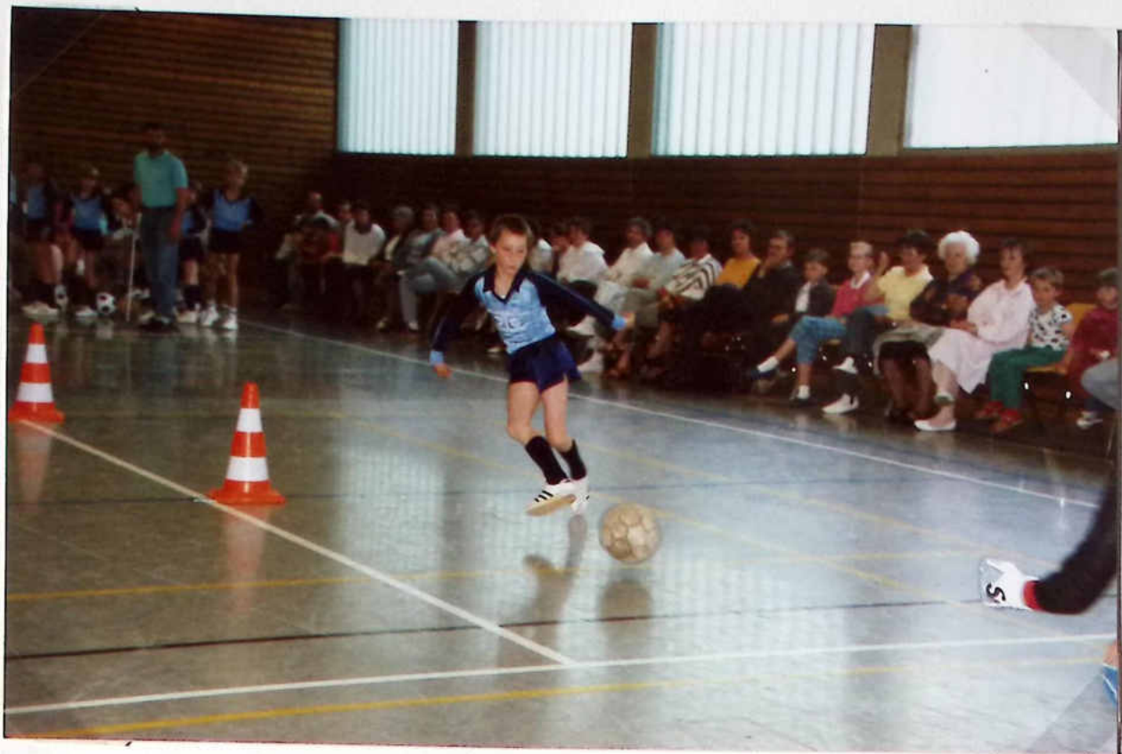
Jubiläums - Sportschau 20 Jahre SC