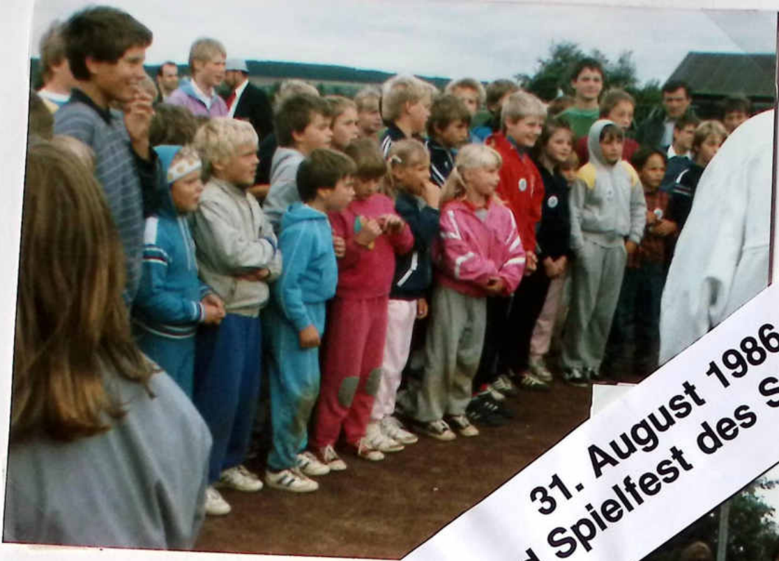
31. August 1986 Sport- und Spielfest des SC Barienrode