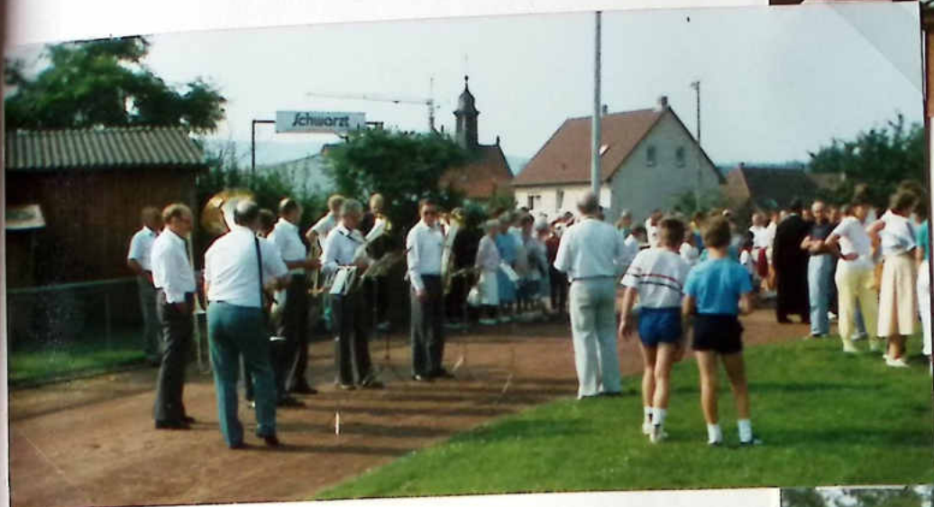
begleitet von der Musikvereinigung