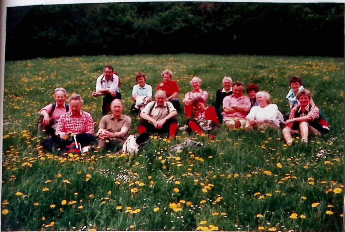
SC Barienrode: Abfahrt nach Bodenwerder zur Tageswanderung im Weserbergland morgen, Sonntag (10. Mai), 9 Uhr, an der Sporthalle.