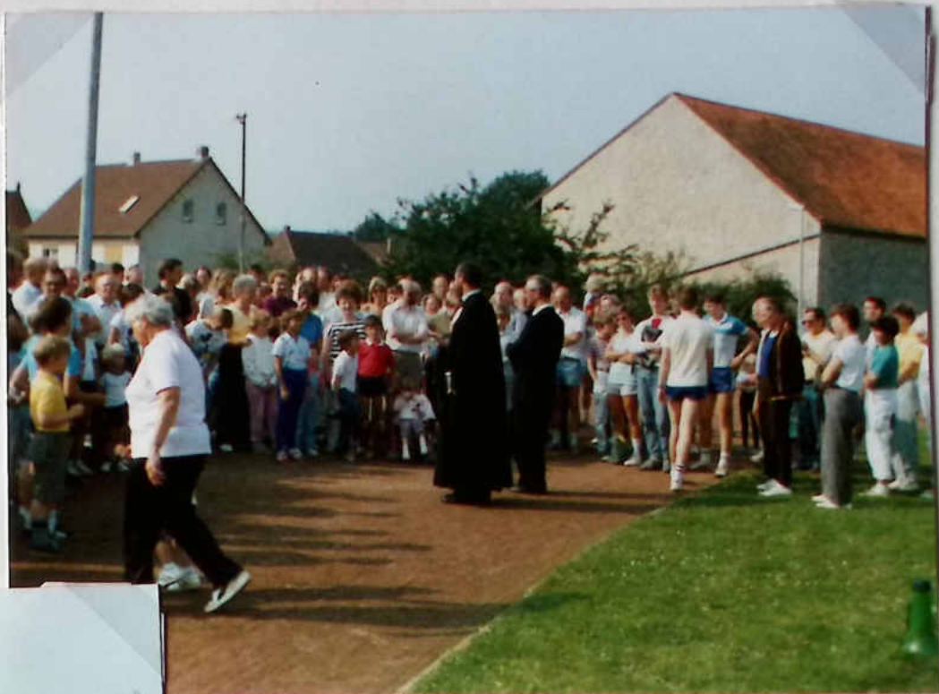
10 Uhr - Ökumenische Ankunft auf dem Sportplatz -