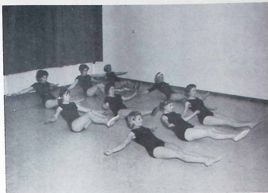
Frauengymnastik im ausgeräumten Klassenzimmer