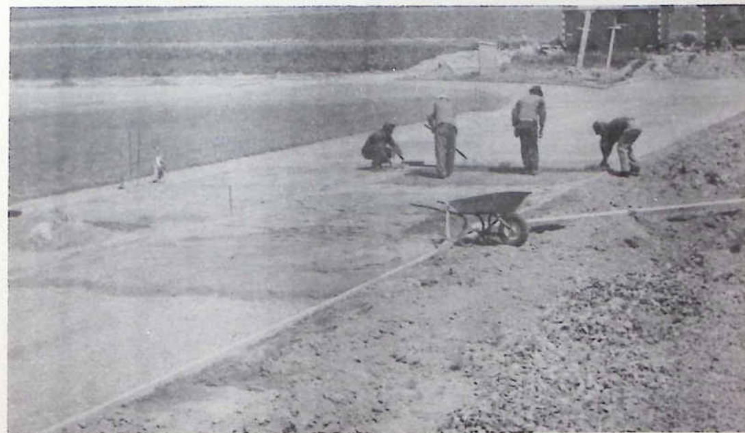
Die neue Sportanlage im Bau